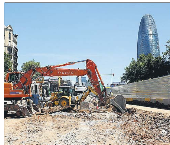
Desmontaje de la anilla viaria de Glòries, ayer. AJ BARCELONA