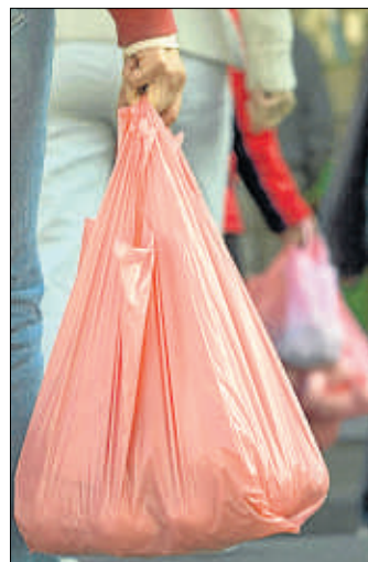
Menys bosses a Andorra

TRIBUNALS ▶ Un jutjat de Barcelona condemna el CatSalut a pagar 1,3 milions d'euros als pares d'un nen que es va quedar tetraplègic per una incorrecta atenció durant el part a l'hospital Santa Tecla de Tarragona fa deu anys. La família i els seus advocats lamenten que els metges responsables continuïn exercint. La lesió causada a les cervicals ha deixat el nen absolutament dependent.