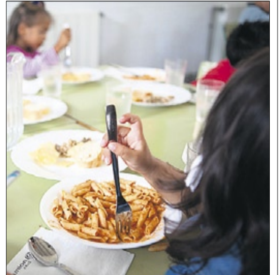
▶▶ Nens dinant a l'escola.

« Proposàvem plans de cooperació i els pares preguntaven què fèiem aquí pels nens »