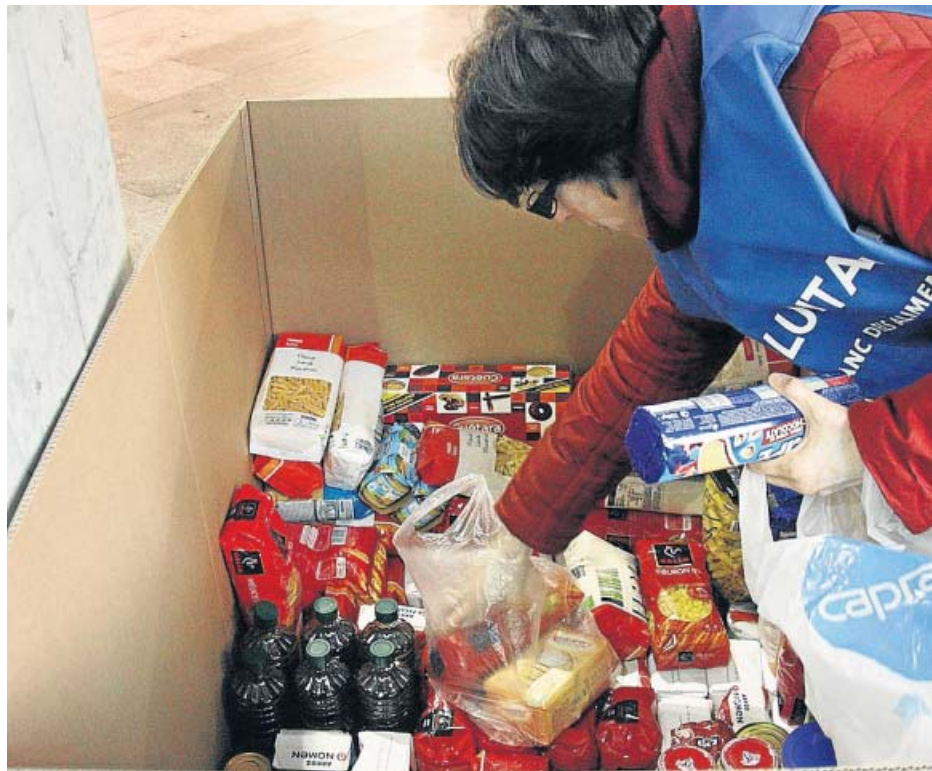
L'Ajuntament facilita l'accés als aliments als ciutadans necessitats mitjançant una targeta.

El projecte espera poder fomentar la solidaritat ciutadana amb aquesta causa amb la donació d'un percentatge de les seves compres a determinats establiments. Es dotarà, així, d'un fons econòmic solidari extra per augmentar els recursos dis-