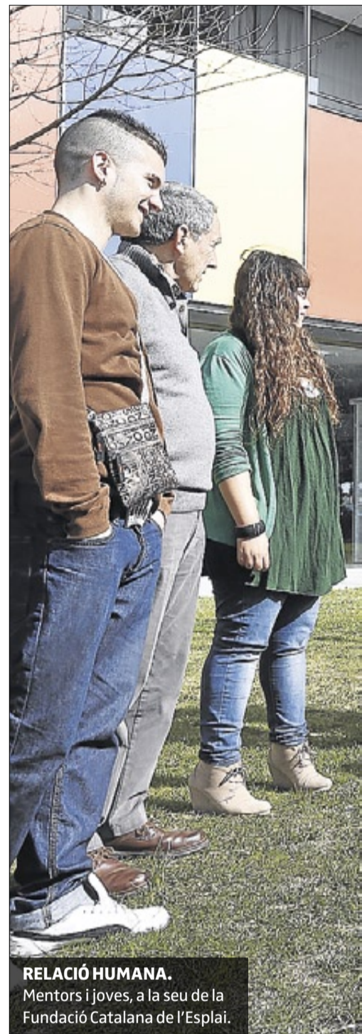
RELACIÓ HUMANA. Mentors i joves, a la seu de la Fundació Catalana de l'Esplai.

Són els joves, que ja han superat la seva formació en oci (150 hores), els qui trien el seu mentor. Cada un d'aquests últims es pot ocupar de dos o tres joves com a màxim i, prèviament a l'elecció, presenten la seva candidatura davant el conjunt