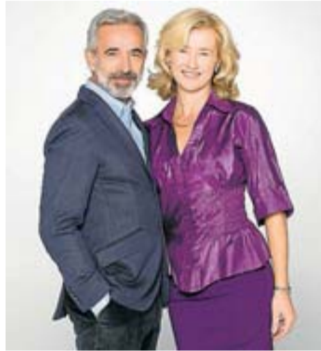
Imanol Arias i Ana Duato protagonitzen Cuéntame.