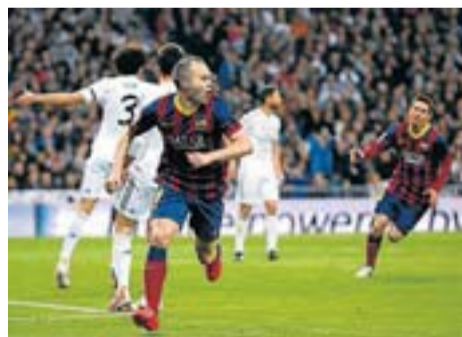
Programes més vistos diumenge a Catalunya

El Madrid-Barça de diumenge només es va poder veure per canals de pagament, però TV3 també en va treure profit. El Hat-trick Barça que va oferir tot just acabat el matx va liderar clarament la seva franja, amb 457.000 espectadors i un 18,2% de quota de pantalla, i va ser el segon espai més vist del dia, només per darrere del Telenotícies migdia . De fet, però, TV3 ja havia liderat entre els canals en obert durant el partit, primer amb el TN vespre i després amb el 30 minuts , que van ocupar el quart i el cinquè lloc del rànquing diari. Pel que fa a la tarda, l'especial d'Antena 3 sobre la mort d'Adolfo Suárez va superar els de Telecinco i La 1, però el domini de la franja se'l van repartir TV3 -amb l' APM? Extra i la pel·lícula La boda de la meva nòvia - i Cuatro -que va imposar-se durant el tram final de la franja amb el film Pánico en el aire -. Al global del dia, la televisió catalana va fer un 12,9% de share i va superar en 4,9 punts Telecinco, que va ser segona. Això va permetre a TV3 empatar amb el canal de Mediaset al primer lloc de l'acumulat mensual, amb un 12%.