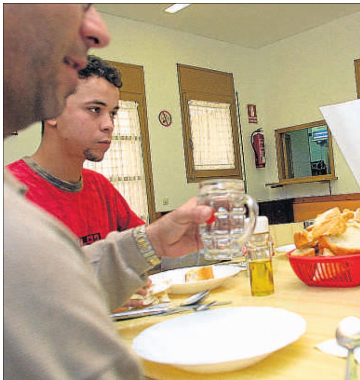
VICENÇ LLURBA / ARXIU

Càritas vol un ajut per a 700.000 famílies sense ingressos