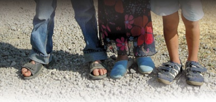
PERCENTATGE DE JOVES (PER SOTA DE 18 ANYS) EN RISC DE POBRESA*