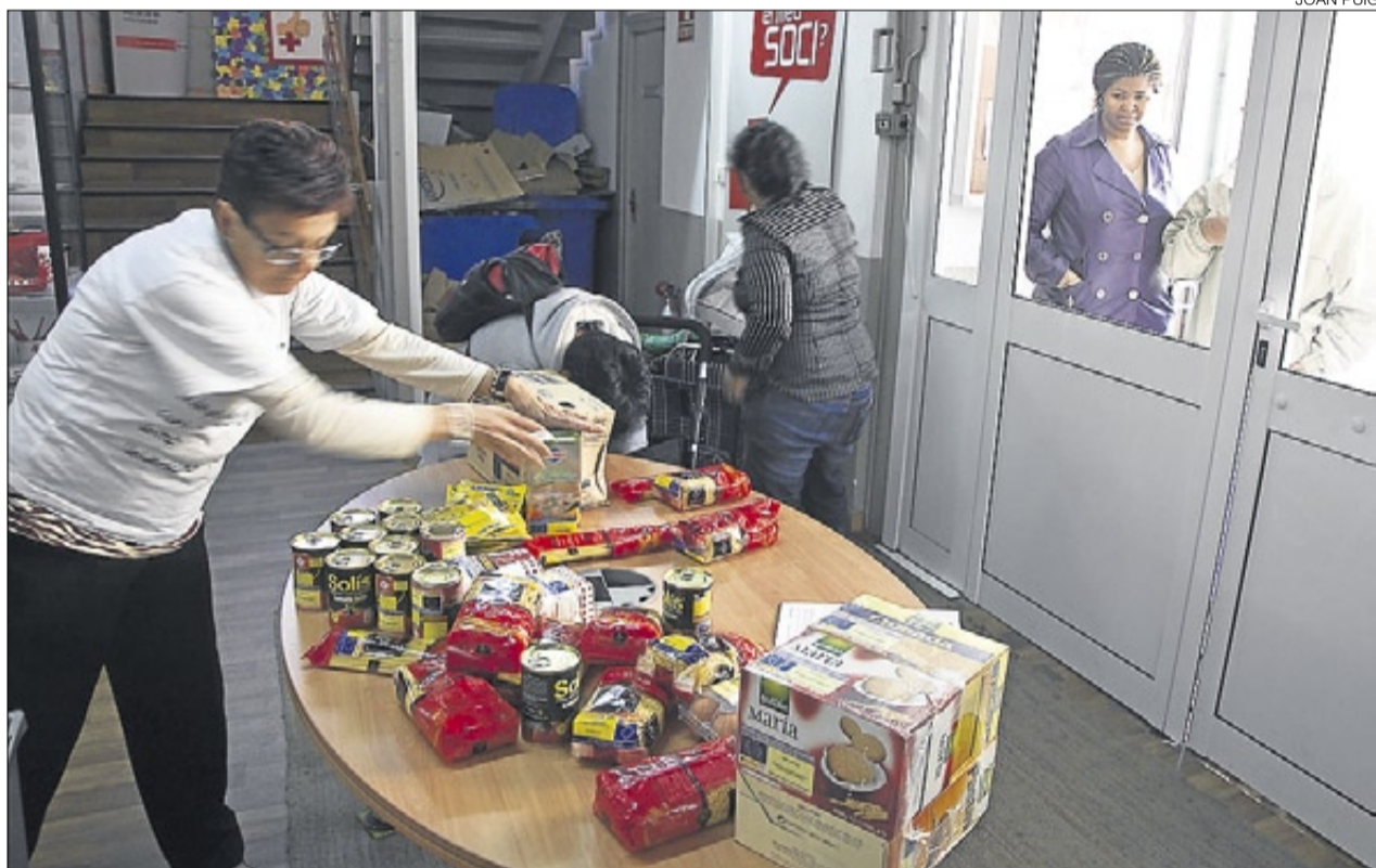
► Repartiment d'aliments per a persones en situació de dificultat, en un local de la Creu Roja de l'Hospitalet.

REDUCCIÓ DEL CAPITAL SOCIAL // El resultat d'aquesta dissimetria no s'observa a curt termini perquè les retallades no afecten les necessitats immediates, però a mitjà i llarg termini «es pagarà amb una reducció del capital social». «Els menjadors socials segueixen servint àpats cada dia, això és el que es veu, però tota l'activitat educativa, d'integració, ocupabilitat, formació, etcètera, d'altres entitats es perd», segons Carreras.