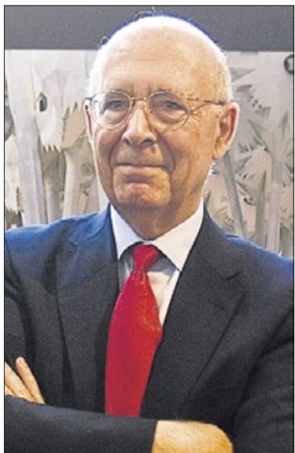
Joan Rigol EXPRESIDENT DEL PARLAMENT

«A Madrid intenten reeditar el 'pla Ibarretxe' sense veure que es tracta d'una reivindicació social»