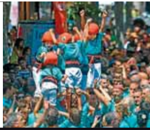
Jornada castellera a Mataró

Minyons, Vilafranca i Capgrossos fan de Les Santes una diada extraordinària