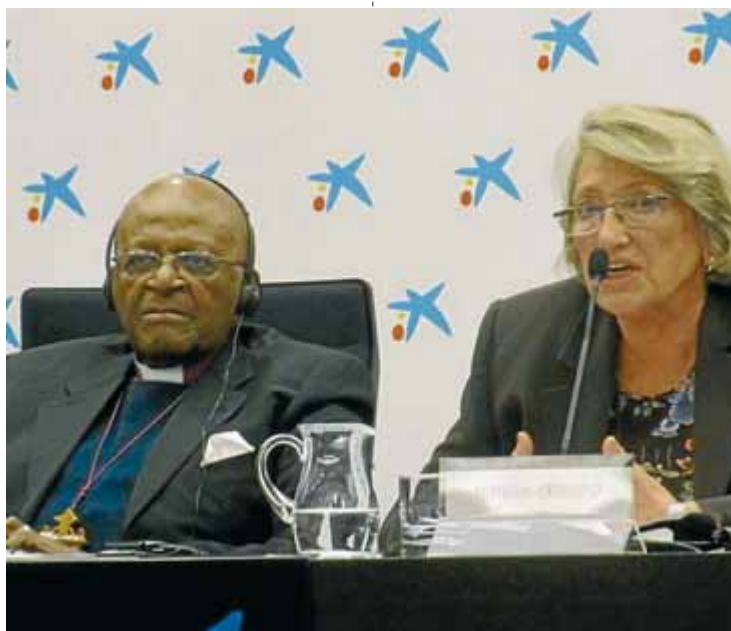
L'arquebisbe Desmond Tutu i Teresa Crespo, d'ECAS, ahir

Peça clau en la lluita contra l'apartheid a Sud-àfrica, l'arquebisbe va recordar la transició que el seu país va viure “de l'opressió i la injustícia cap a la democràcia i la llibertat”. De to-