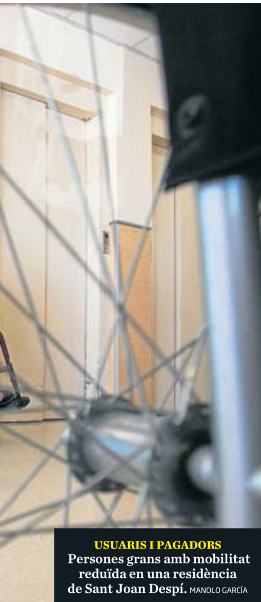
USUARIS I PAGADORS Persones grans amb mobilitat reduïda en una residència de Sant Joan Despí.