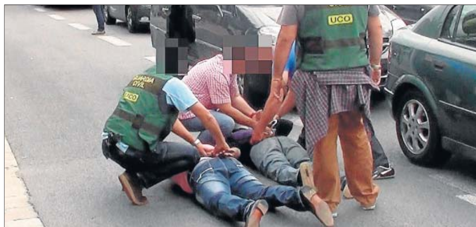
Agentes de la Guardia Civil detienen a dos de los traficantes, que estaban asentados en Barcelona.

Armas de fabricació rusa. La Guardia Civil ha detingut en Barcelona a quatre membres de una red de supuestos narcotraficantes que trataban de utilizar Catalunya como base de operaciones para ofrecer misiles de fabricación rusa a grupos paramilitares o violentos. El grupo tenía la capacidad para poder entregar de forma inmediata entre 3 y 5 misiles.