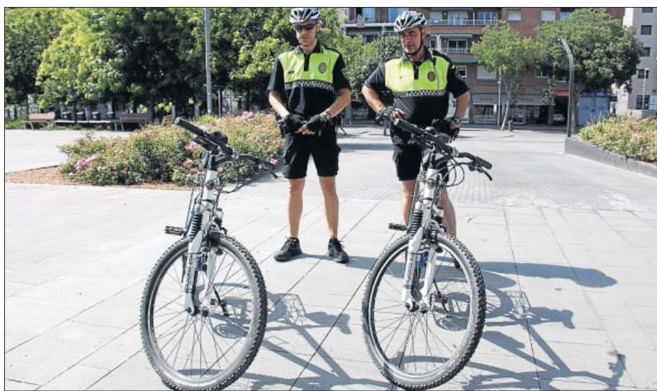
SANT CUGAT ESTRENA 'POLICIA VERDA'. La Policia Local de Sant Cugat del Vallès començarà a patricular els caps de setmana en bicicleta per parelles per controlar les zones peatonals i pistes forestals. Vol ser «més propera» al ciutadà.

En el cas de les botigues i negocis, les denúncies també han crescut. I això es deu, en bona part, al fet que es vol cobrar la indemnització de l'assegurança, segons matisa el tinent