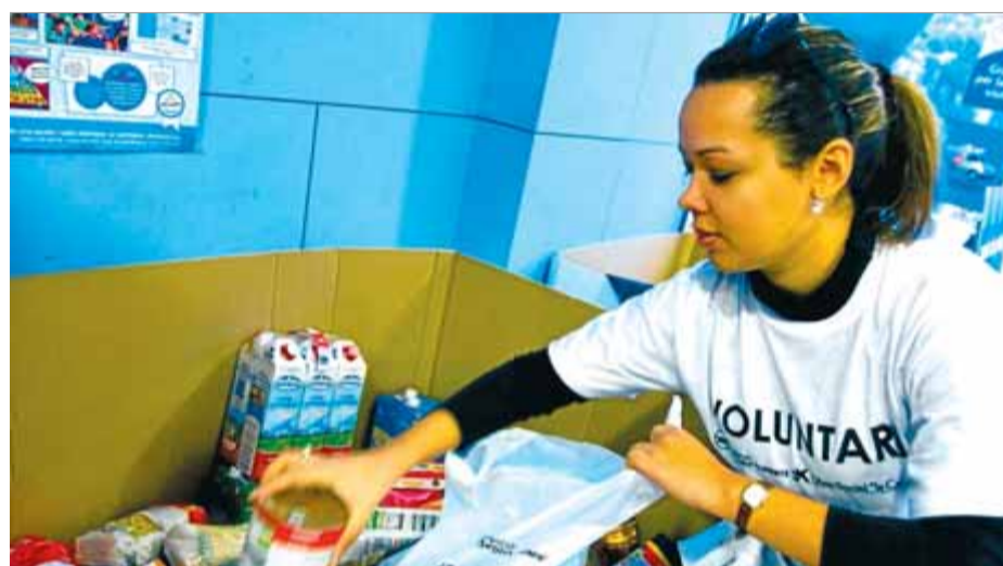
Les ONG insisteixen que no s'aturi la solidaritat durant l'estiu