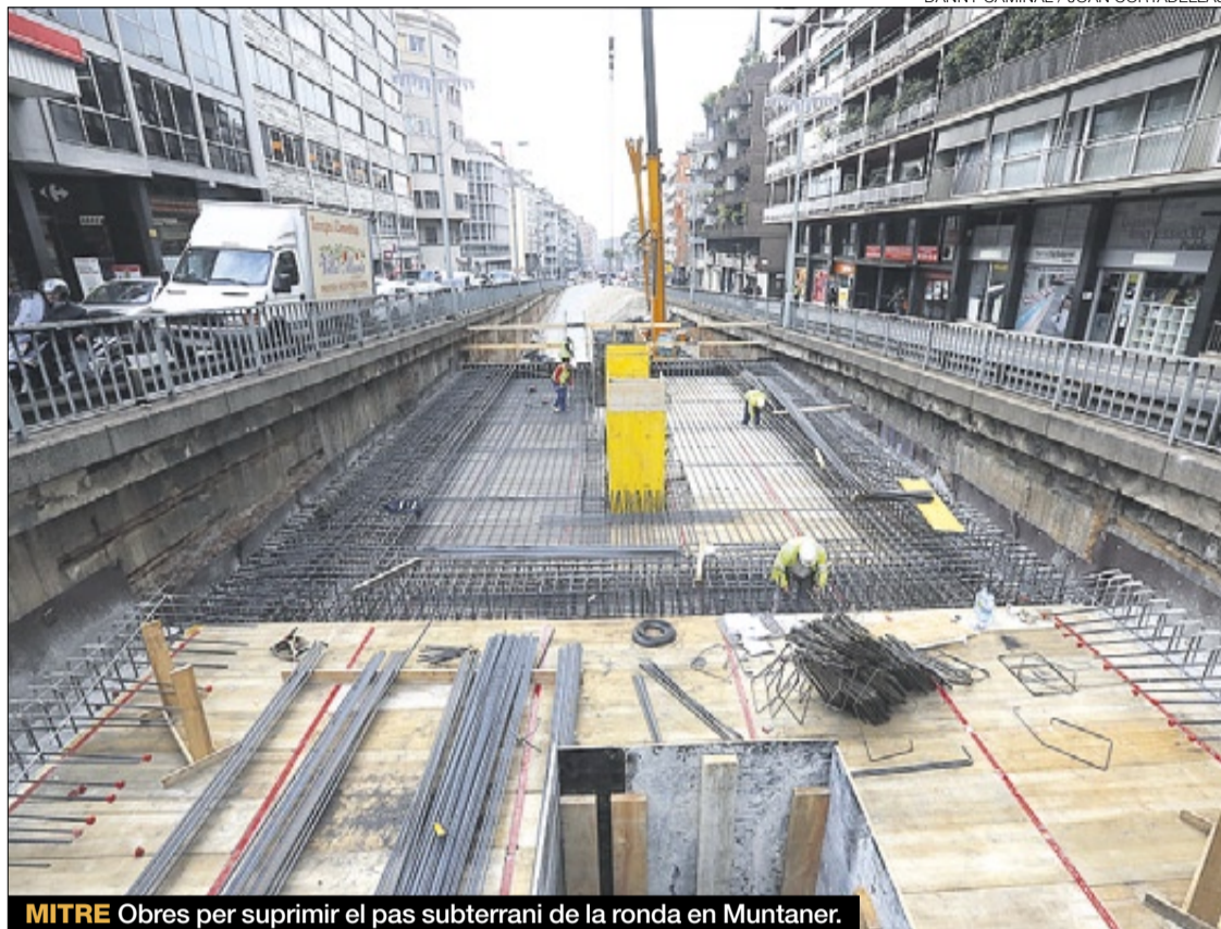
MITRE Obres per suprimir el pas subterrani de la ronda en Muntaner.