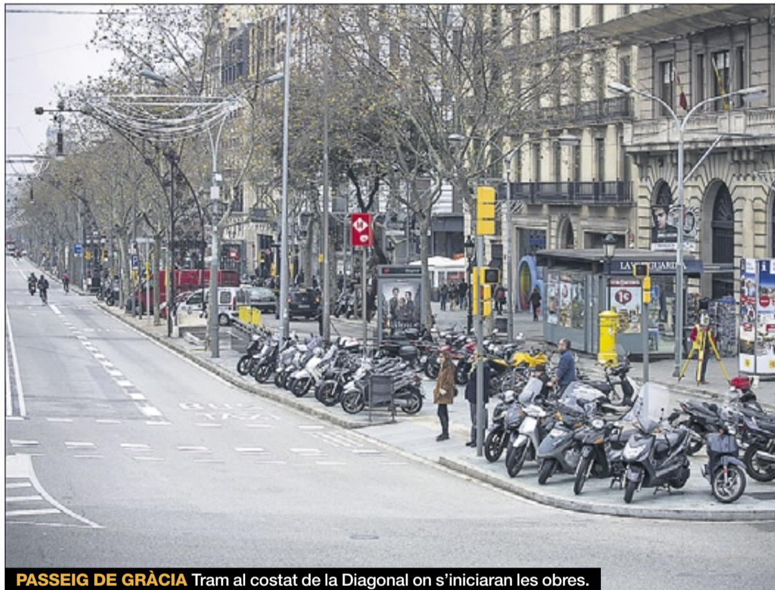
PASSEIG DE GRÀCIA Tram al costat de la Diagonal on s'iniciaran les obres.