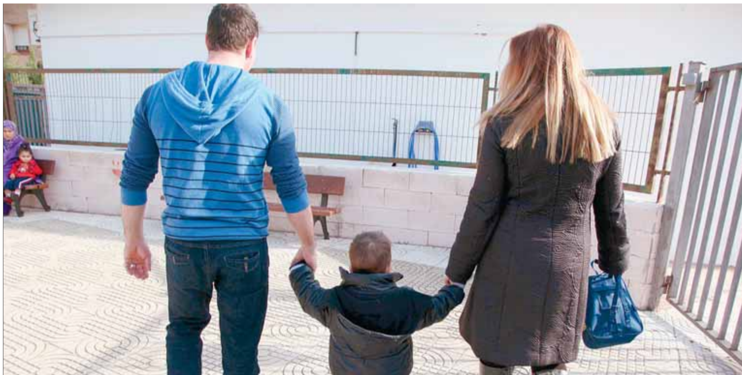
Una parella amb un fill. De l'excepció a la norma en el model de família de l'Estat espanyol ■ JUDIT FERNÁNDEZ